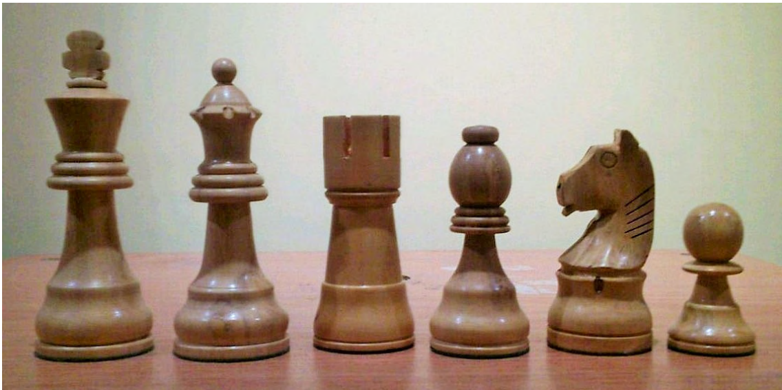
La Escala Real de las piezas Staunton . Las Torres, al fin, con su proporcionado nivel