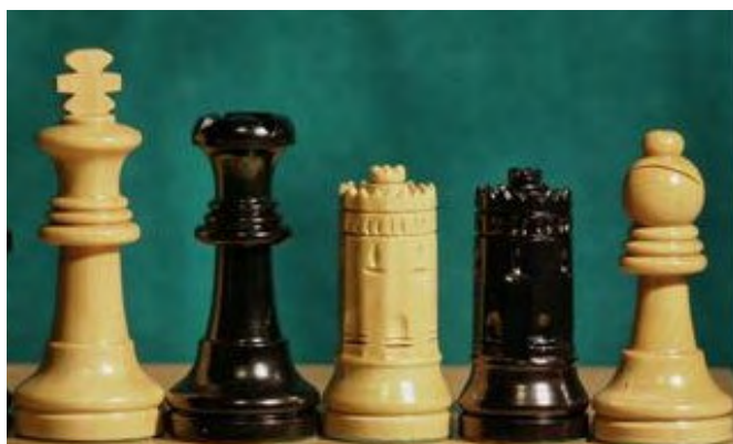
Torre del Oro Kárpov versus Kaspárov, Sevilla, 1987