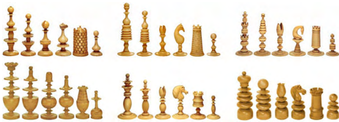
Modelos de ajedrez del siglo XIX en Reino Unido: Inglés, Washington, Windsor, Regency, Calvert y St. George. En todos los modelos las Torres son más bajas que los Alfiles y Caballos.

En la mitad del siglo XIX existía una gran demanda de juegos de ajedrez, había en el mercado diversos modelos tan semejantes que producían frecuentes confusiones entre las piezas.